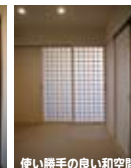
使い勝手の良い和空間

■所在地/宇部市恩田2丁目■検査済証番号:H28建査建住セ山0703号■構造/木造モノコック構造2階建■外壁/防火サイディング15mm■電気/中国電力■上下水道/宇部市■築/平成28年12月■校区/恩田小学校・常盤中学校/売主