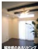
解放感のあるリビング